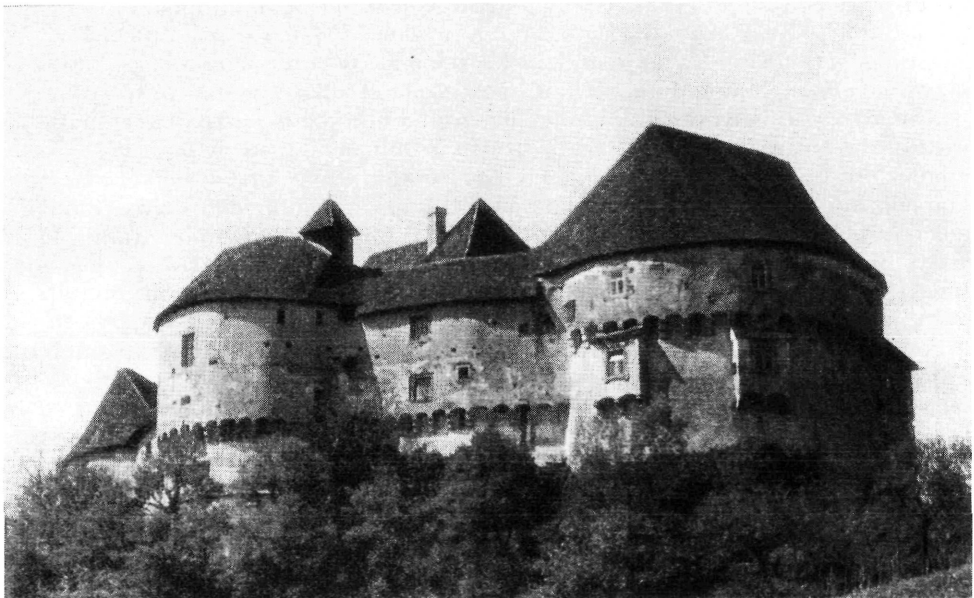
Stari grad Veliki Tabor u Hrvatskom Zagorju sjedište obitelji Ratkaj

U ljetu 1750. portugalski kralj JUAN V. (1689. – 1750.) zamolio je papu BENEDIKTA XIV. da mu naznači deset isusovaca »vještih matematika« koji bi u Brazilu imali izraditi geografske karte krajeva koje je namjeravao zamijeniti sa Španjolskom. Toj se ekspediciji, uz određene uvjete, namjeravao pridružiti i R. BOŠKOVIĆ (L. 7. – s. 319.).