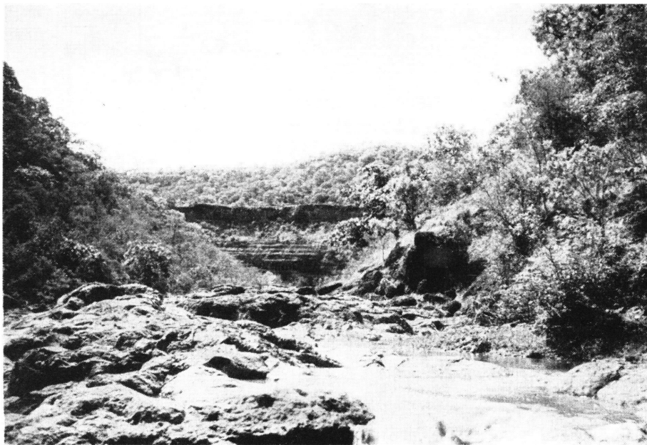
Kanjon Ajante sa spiljama u pozadini