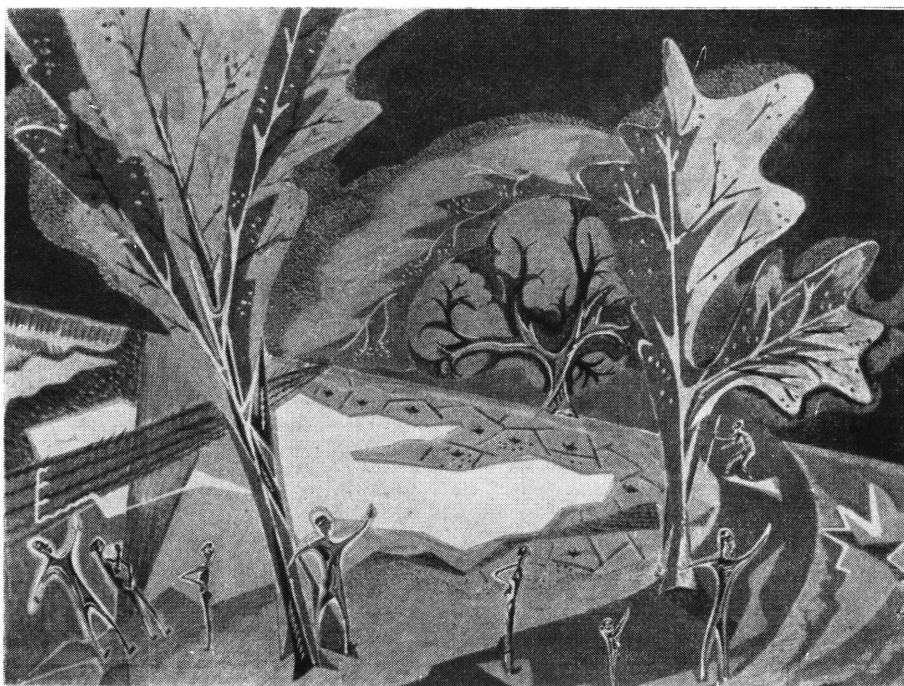
D. R. Kowshik, Skakavci , tempera

vera, u pravilu svijetli oker. Čisti crveni cinoberi vrlo su česti za oznaku puta, bilo bogova bilo heroja iz mitologije, kao na pr. boga majmuna Hanumana, koji je osvojio Ceylon. No u isto vrijeme ne postoji zapreka, da Hanuman bude i u kojoj drugoj boji, ako to zahtijeva umjetnikova imaginacija i odnos boja. Ne može se poreći, da u tom stavu prema značenju boje, osim estetskih razloga, ne postoje i razlozi simbolike. Simbolizam se i danas sreće vrlo često u slikarstvu, gdje je on nađen sretnije, i u kiparstvu sa mnogo manje uspjeha. No simboli su uopće karakteristični za istok kako u umjetnosti, tako i u ostalim životnim manifestacijama.