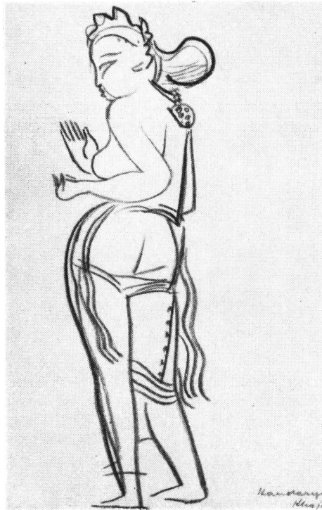
Figura, hram Khandharya Maladeva u Khajurahu Croquis Z. Price

su grad Mohenjo Daro sa preko dva milijuna stanovnika, sa urbanističkom osnovom i kanalizacijom nastalom u trećem stoljeću prije naše ere. Brončana figura plesačice, ovdje pronađena, pokazuje kvalitete, koje daleko prelaze svaki pojam o primitivnom.