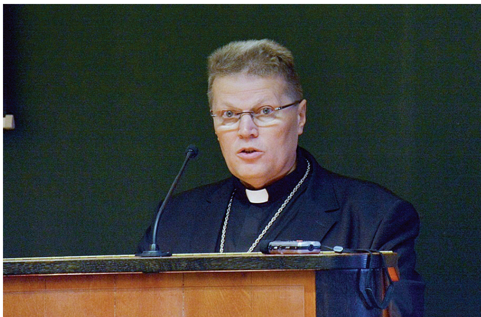
Riječ nadbiskupa đakovačko-osječkoga mons. Đure Hranića