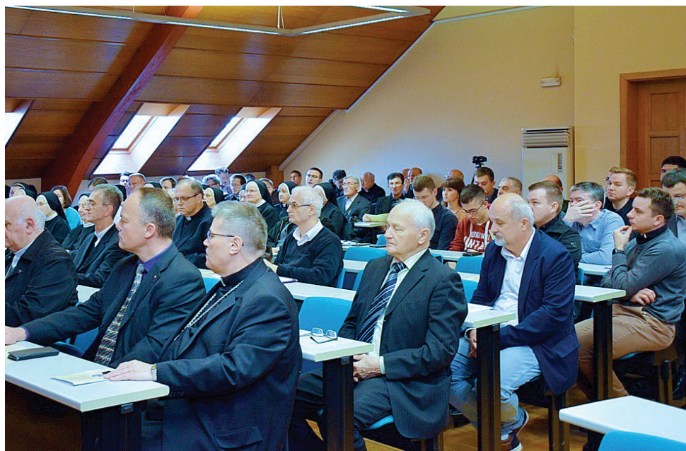
U dvorani Katoličkoga bogoslovnog fakulteta u Đakovu bilo je od 130 do 150 sudionika