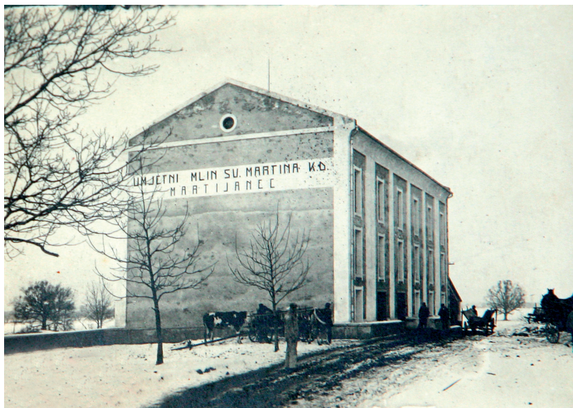
Slika 5. Mlin u Martijancu, 1922.