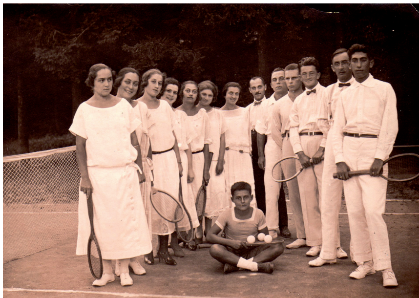
Slika 8. Teniski klub u Ludbregu, oko 1922., priv. arhiv