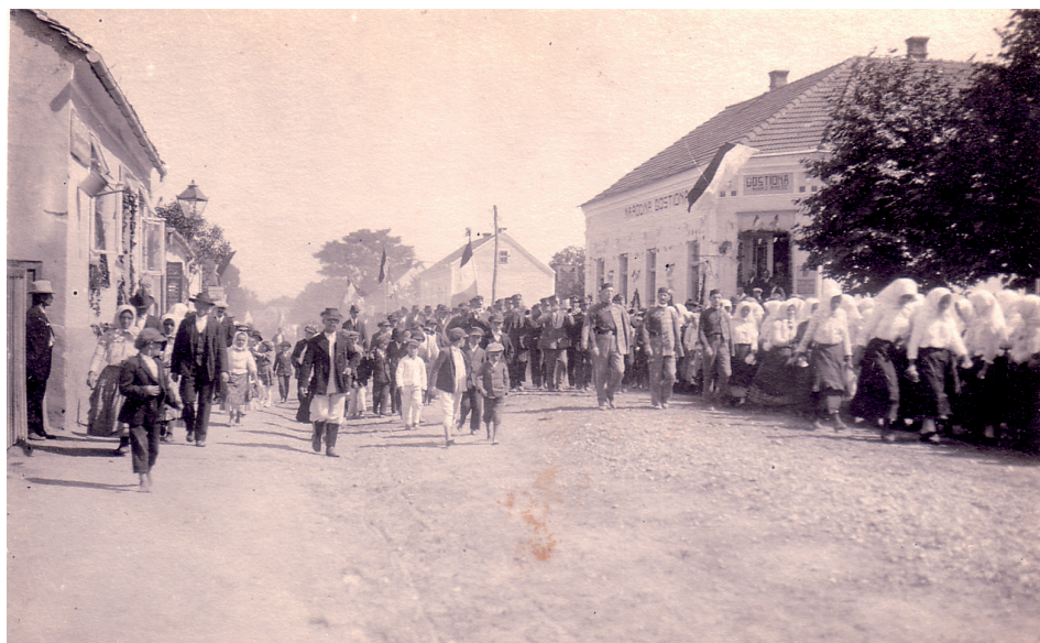
Slika 10. Svečana proslava u Ludbregu 1925., razglednica