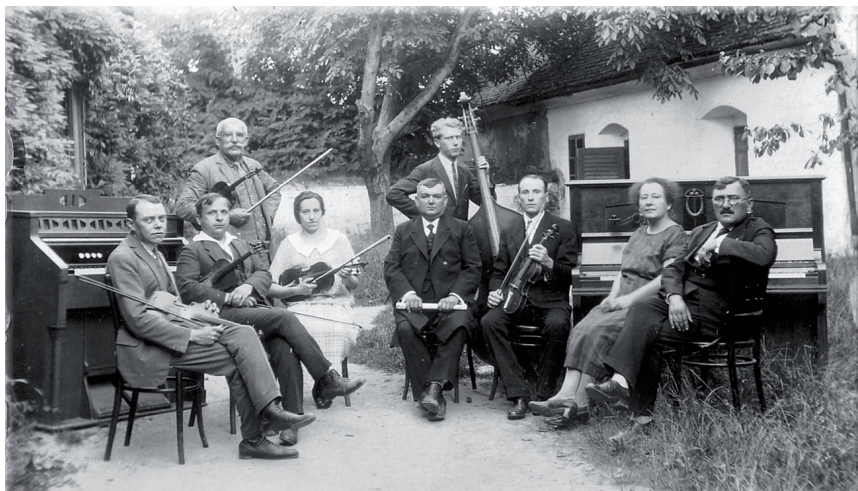
Slika 7. Salonski orkestar u Ludbregu, oko 1923.