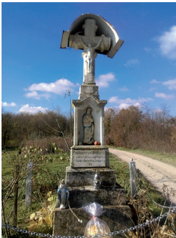
Slika 2. Raspelo podignuto u znak zahvalnosti za povratak vojnika Jambrušića iz Velikog rata (1918.), Slanje

vijeću u Zagreb. No, potrebe za posebnom intervencijom nije bilo jer je nakon toga zavladao relativno mirno stanje. 17