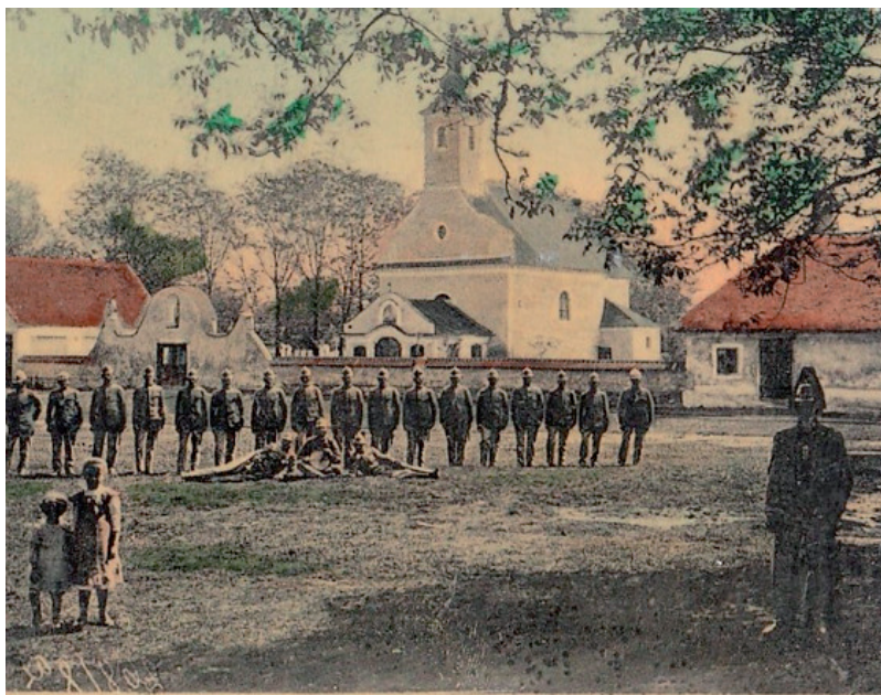
Slika 6. DVD Mali Bukovec 1923.