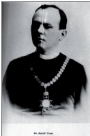
Slika 1. Rudolf Vimer, rektor Zagrebačkog sveučilišta 1900.

(* Bjelovar, 21. III. 1863. – † Zagreb, 28. X. 1933.)